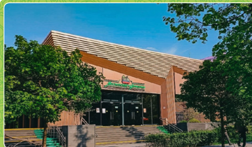
СТИЛЬ «ФЕРМЕРСКАЯ ЯРМАРКА»